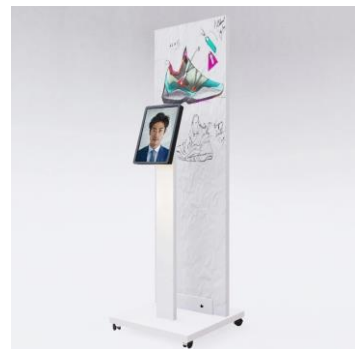
タブレットタイプ