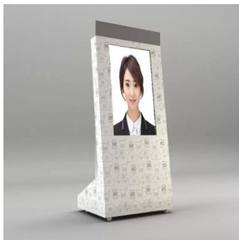
サイネージタイプA

下記4種類はレンタル利用可能な筐体となります。ただし、台数に限りがございます。なお、ショップなどのイメージに合わせたオリジナル制作も可能です。